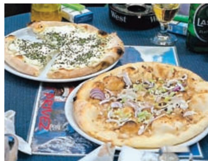
Ni pica, pač pa posmodula.

Kolesarji so nato nadaljevali skozi Predoslje in izlet sklenili v Kranju. Udeleženci so prevozili 43 km, naredili pet postankov in na štirih mestih pokusili domačo lokalno hrano. Kolesarske vožnje se je udeležilo 15 kolesarjev vseh starosti. Ker je bil lep sončen dan, so med potjo lahko občudovali lepoto krajev pod Storžičem, ki so že sicer pogost cilj ali postanek na kolesarskih poteh.