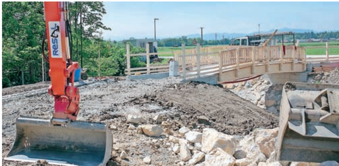
Gradnja mostička v grajskem parku

telj in s tem tudi približno 20 delovnih mest. Upam, da nam bo uspelo v gradu Dvor pravočasno zagotoviti manjkajoče postelje in tudi delovna mesta. Tako bi bil grad Dvor nekakšna depandansa Doma starejših občanov Preddvor in bi bila tudi pod njegovim upravljanjem. Poleg tega bi želeli pridobiti v gradu tudi muzej slovanstva, kajti nad Bašljem imamo arheološko najdišče, kjer se obeta zelo bogata najdba iz 8. stoletja. To bi bil muzej nacionalnega obsega. Poleg tega bi bili v gradu