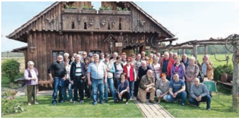
Preddvorski čebelarji na nedavni strokovni ekskurziji