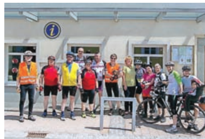
Kolesarski postanek v Preddvoru

Na kolesarskem izletu po podeželju so se udeleženci ustavili v Preddvoru in pokusili domačo jed – posmodulo.