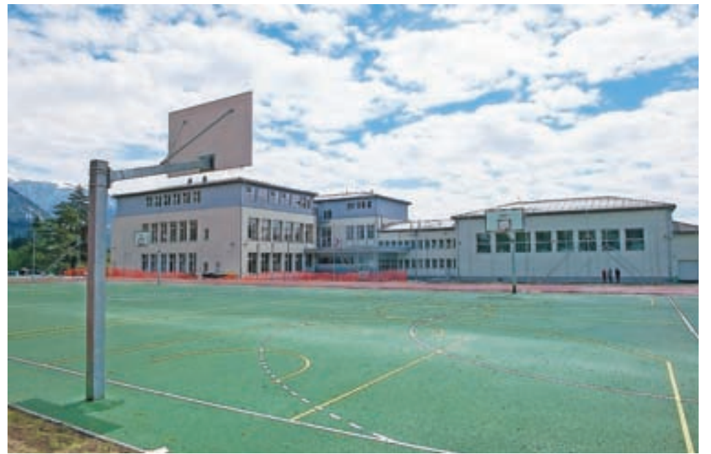
Preddvorski šolarji in športniki so dobili nova športna igrišča.

Preddvor – Prve dni septembra je zaradi dotrajanosti starega igrišča veljala prepoved uporabe, 9. maja lani pa so zabrnili gradbeni stroji. Tako so bili starejši učenci kar devet mesecev prikrajšani za vadbo zunaj, mlajši pa so zaradi prezasedenosti telovadnice namesto na športnem igrišču telovadili v učilnicah, gostovali v telovadnici vrtca ali pa se razgibavali ob otroških igralih in na njih. Najbolj navdušeni nogometaši iz podaljšanega bivanja so si zasilen žogobrc privoščili kar na zelenici med šolo in vrtcem ali celo v kotičku otroškega igrišča. Običajno večina šolarjev od tretjega razreda navzgor rekreacijski odmor – če le vreme to dopušča – preživlja zunaj. Nadihajo se svežega zraka in potrošijo odvečno energijo, kar jim omogoča boljše zbranzost pri urah v šolskih klopeh. Številni fantje sicer v šolo prihajajo pol ure prej, da pred poukom še malo brcajo žogo, pa tudi po pouku nekateri zaradi iste dejavnosti kar ne znajo domov ... Letos so pač prostor za sproščanje odvečne energije in druženje morali poiskati drugje. Seveda smo se obnove igrišča tako šolarji kot tudi zaposleni zelo razveselili, čeprav se