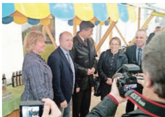
Preddvorsko stojnico je na sejmu v Komendi obiskal tudi predsednik države Borut Pahor.