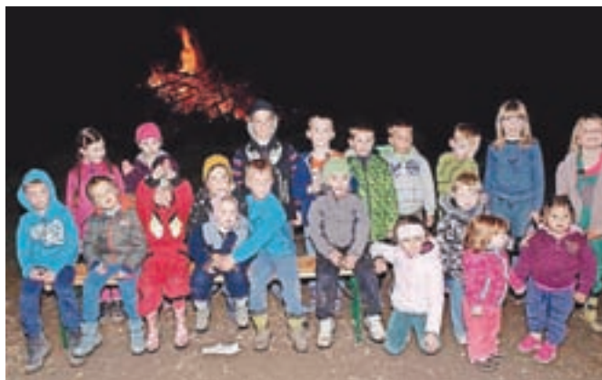
Druženje ob kresu v Kokri