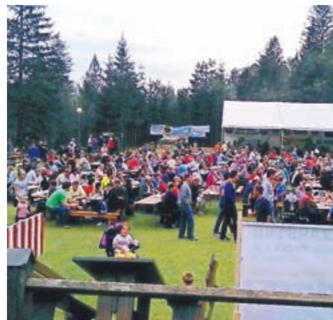
S kmečkega praznika pod Storžičem

Vaško veselico organiziramo 27. in 28. avgusta, 27. avgusta bašljanski fantje organizirajo večer z ansamblom, 28. avgusta pa že 31. tradicionalno prireditev Kmečki praznik pod Storžičem. Pokazali bomo življenje in delo nekoč, kmečke žene bodo ustvarjale domače dobrote, drugi Bašljani bodo kot vedno aktivni povsod, da veselica uspe, bodo pripravili bogat srečelov. Dobrodošli v Bašlju 27. in 28. avgusta na nogometnem igrišču pod šotorom ... Fletn' n'm bo.