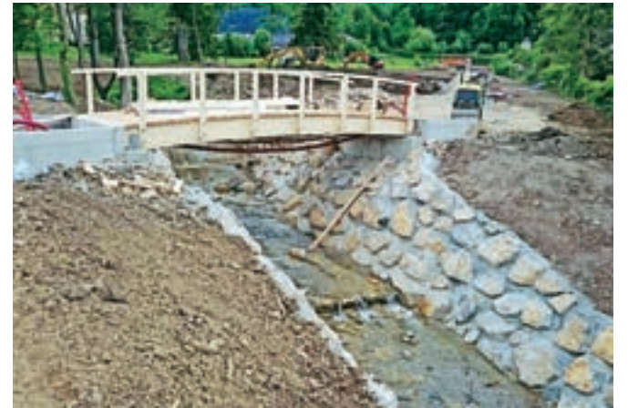
Ali se ne bi dalo narediti drugače?

Pa še malo o lepših straneh naših voda. Vsekakor sta to